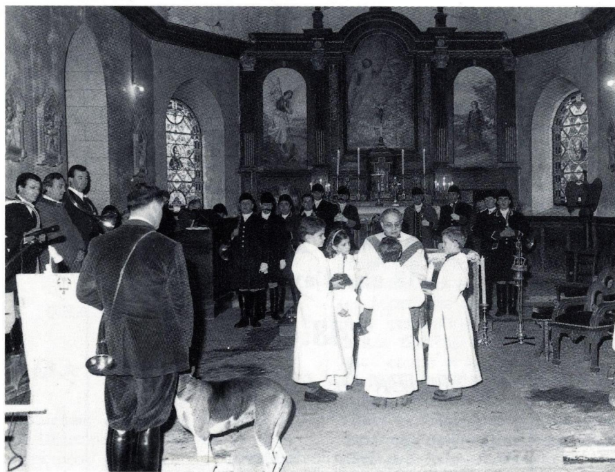
Saint-Hubert en l'église de Fleury-la-Forêt.