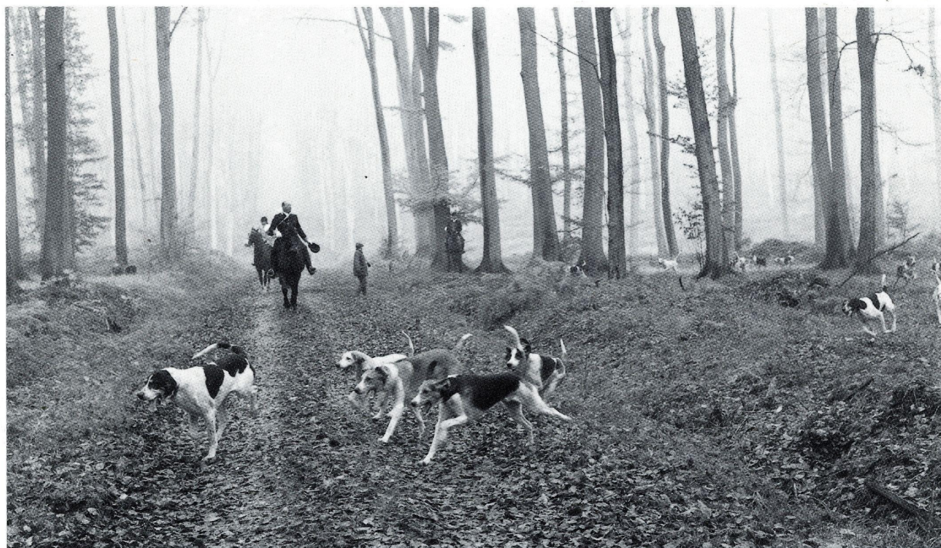
Bien-aller en futaie.