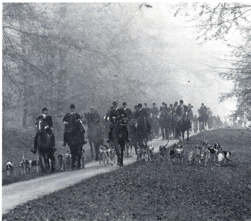
Forêt de Lyons. Départ pour l'attaque.

L'Équipage des « Pierres Cassées », qui tient son nom d'une enceinte de la forêt de Lyons, a fait ses premières armes dans la voie du lièvre durant six ans, en chassant principalement en Normandie mais aussi en déplacement, notamment en Bretagne et dans les Landes. A cette époque, l'équipage était constitué d'un superbe lot d'une trentaine de Harriers gris du Somerset, chasseurs, rapides, mais aussi sages et criants. Compte tenu du faible nombre de sorties et des difficultés de suite sur certains territoires, les Maîtres d'équipage tenant le plus grand compte des souhaits de leurs hôtes, la meute prenait à cette époque une douzaine de liè-